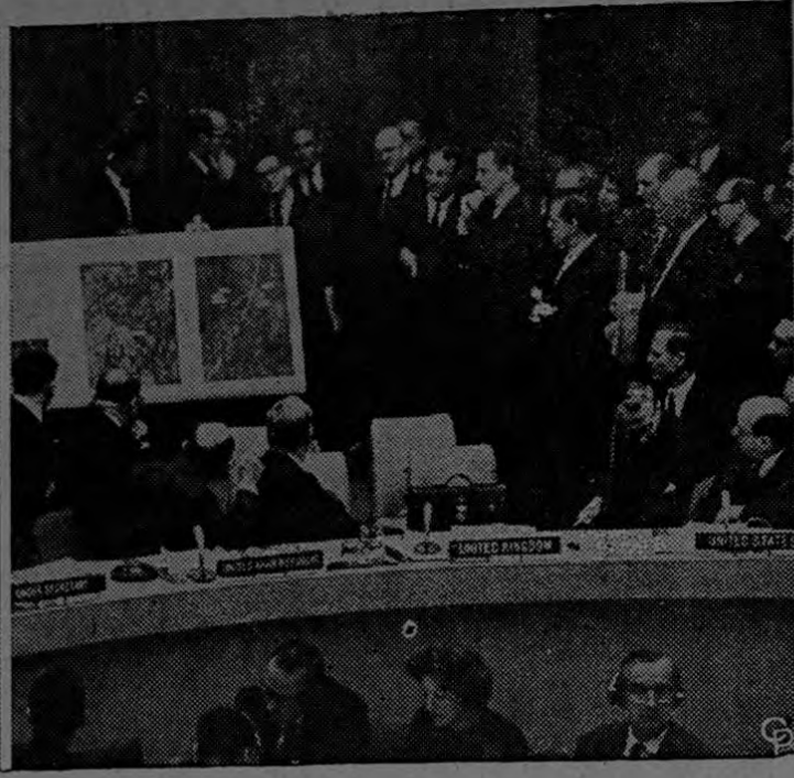
Stevenson le respondió que estaba "en esos momentos en el tribunal de la opinión mundial". Luego Stevenson (a la derecha, hacia el frente) mostró al Consejo de Seguridad fotografías de los emplazamientos de proyectiles en Cuba, destacando el progreso de esas construcciones.