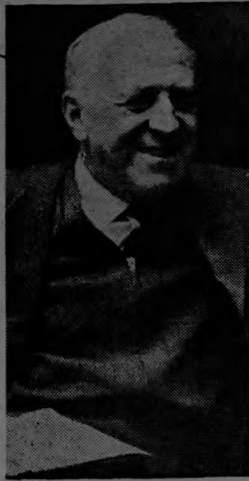
Valerian A. Zorin, representante soviético ante las Naciones Unidas, ríe mientras el embajador de los Estados Unidos, Adlai Stevenson, lo desafía a que niegue que Rusia ha establecido bases de proyectiles propios para atacar, en Cuba. Zorin rehusó decir sí o no, añadiendo que no estaba en un tribunal de Estados Unidos.